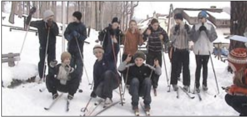
Zabawa na stoku była przednia

Uczniowie i opiekunowie z Gimnazjum Miejskiego w Jedlinie-Zdroju serdecznie dziękują Centrum Kultury w Jedlinie-Zdroju za pomoc w zorganizowaniu imprezy na wyciągu narciarskim „Karolinka” oraz Restauracji „Charlotta” za udostępnienie punktu gastronomicznego przy stoku.