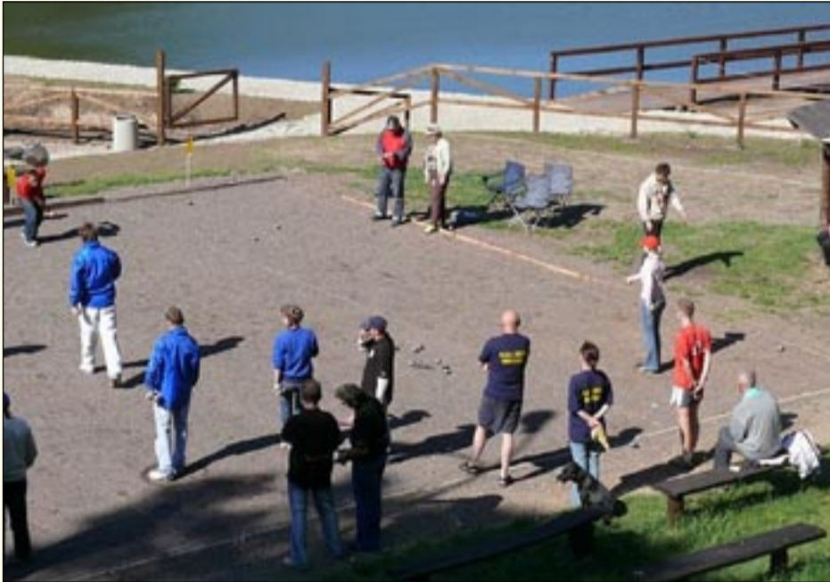
Maj stać będzie w Jedlinie-Zdroju pod znakiem zawodów w petanque

Miesiąc maj w Jedlinie-Zdroju stać będzie pod znakiem wielkich imprez petanque o międzynarodowej randze. Już 1 i 2 maja 2009 roku odbędzie się V Międzynarodowy Festiwal Petanque. To turniej, który dzięki wysiłkowi wkładanemu w jego organizację w poprzednich latach, zyskał wysoką renomę wśród najlepszych graczy w tej dyscyplinie w Polsce. W zeszłym roku uczestniczyło w nim ok. 50 drużyn z czołowych klubów petanque z całego kraju, w tym mistrzowie Polski seniorów. Oprócz krajowych graczy startują także drużyny z zaprzyjaźnionych miast z Francji oraz Czech. Formuła Festiwalu umożliwi grę zawodnikom rozpoczynającym swoją przygodę z petanque jak i bardziej doświadczonym graczom. Ma na celu zachęcenie do gry tych pierwszych, poprzez możliwość rywalizacji z tymi drugimi. Festiwalowi towarzyszą liczne atrakcje, które przyciągają rze-