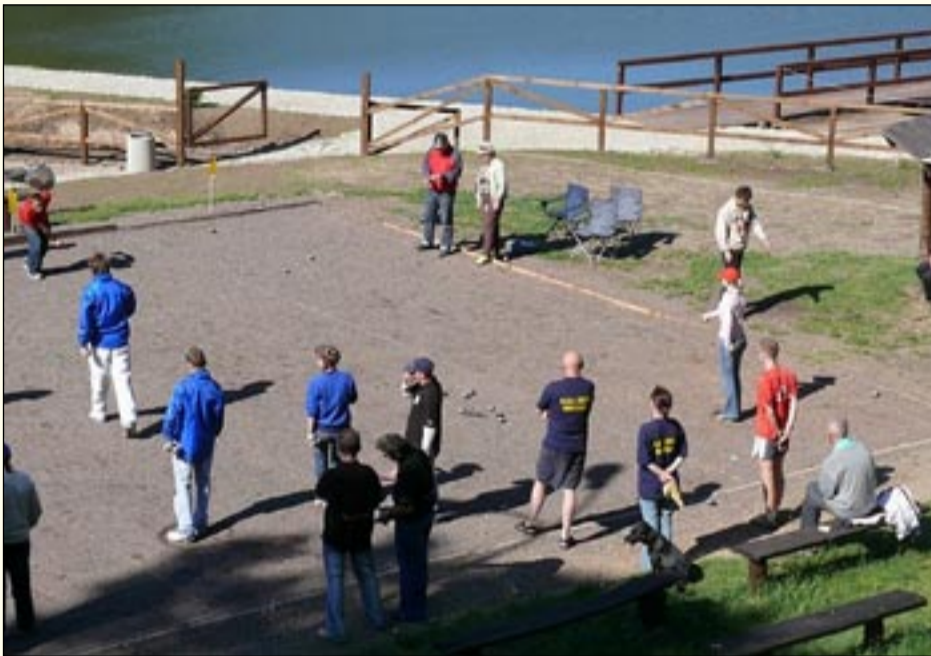
Maj stać będzie w Jedlinie-Zdroju pod znakiem zawodów w petanque

Miesiąc maj w Jedlinie-Zdroju stać będzie pod znakiem wielkich imprez petanque o międzynarodowej randze. Już 1 i 2 maja 2009 roku odbędzie się V Międzynarodowy Festiwal Petanque. To turniej, który dzięki wysiłkowi wkładanemu w jego organizację w poprzednich latach, zyskał wysoką renomę wśród najlepszych graczy w tej dyscyplinie w Polsce. W zeszłym roku uczestniczyło w nim ok. 50 drużyn z czołowych klubów petanque z całego kraju, w tym mistrzowie Polski seniorów. Oprócz krajowych graczy startują także drużyny z zaprzyjaźnionych miast z Francji oraz Czech. Formuła Festiwalu umożliwi grę zawodnikom rozpoczynającym swoją przygodę z petanque jak i bardziej doświadczonym graczom. Ma na celu zachęcenie do gry tych pierwszych, poprzez możliwość rywalizacji z tymi drugimi. Festiwalowi towarzyszą liczne atrakcje, które przyciągają rze-