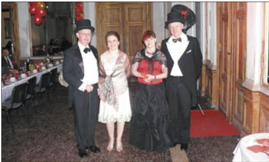
Władze miasta i miłośnicy Jedliny-Zdroju po raz czwarty zorganizowali Bal Charytatywny

Zabawa charytatywna, której celem jest zebranie pieniędzy na fundusz stypendialny, to już tradycja. Stowarzyszenie Miłośników Jedliny Zdroju wraz z Burmistrzem po raz czwarty zorganizowali imprezę w przepięknych wnętrzach Pałacu w Jedlinie. W tym roku z licytacji zebrano ponad 22 tys. zł. Najwyższą kwotę osiągnął obraz olejny