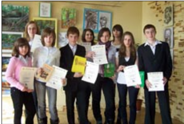
Laureaci konkursu „Pegazik”

Trzymamy kciuki za naszych reprezentantów!